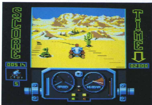
Qu'allais-je devenir ?