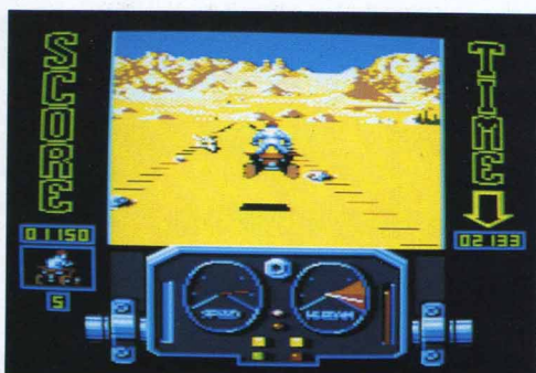
Waaaauu !!! Quel saut !

querez le plus de points, et chaque fois que l'afficheur score à gauche de l'écran comptabilisera 1000 points de plus, pour vous récompenser de vos mérites, vous bénéficierez du cadeau bien utile d'une vie... De même, lorsque vous effectuerez une sortie de piste, ce même compteur boudera et vous refusera les points supplémentaires correspondant au temps de votre escapade dans le bas-côté.