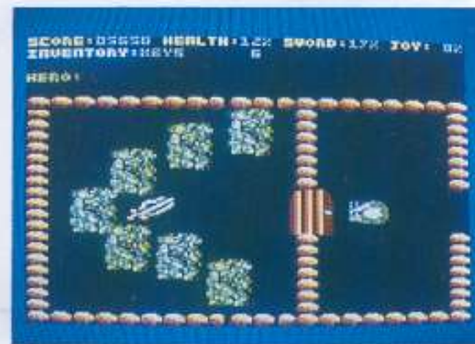
L'épée magique qui vous rend surpuissant.

l'explosion finale du château. En effet, plusieurs paquets de T.N.T. sont disposés dans une pièce; lorsque vous aurez libéré la princesse, que la clé d'or sera en votre possession et que vous aurez débarrassé la route menant à la sortie de toutes les embûches, vous pourrez alors mettre le feu aux poudres.