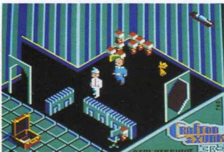
Construisez un échafaudage pour atteindre la seringue.

se recharger en se plaçant sous une "cabine Holophonique" que vous repêrerez grâce au H dessiné sur le haut. Si vous atteignez 0 %, vous devenez vert, signe d'une très mauvaise santé, et la partie s'achève. Aussi, repérez bien les sources d'énergie pour y retourner quand cela devient nécessaire. Chaque fois que vous aurez trouvé une seringue et un endroit où cogite un savant, vous poserez l'aiguille près de la tête pensante, jusqu'à ce qu'il marche dessus (les mouvements du savant sont aléatoires). Si celui-ci commence à adopter une attitude un peu bizarre et qu'un jingle (genre pinpon) commence à sonner à vos oreilles, c'est qu'il va se mettre à table : un chiffre du code commence alors à clignoter. Il faut savoir que vous pouvez trouver la chambre de Zarxas assez facilement, certes, mais que si vous ne prenez pas le bon chemin à l'intérieur de la pièce, alors de façon aussi soudaine qu'inattendue, vous serez écrasé par un objet lourd tombant du plafond : cuisinière, armoire, divan, ou autre gâterie sacrément pesante ! Les directions à respecter dans cette chambre sont donc : 1 en face, 2 à droite, 3 derrière, 4 à gauche. Chaque fois que vous réinitialisez le jeu, le code d'accès sera changé mais la position des seringues et des savants sera la même. Quant à la dernière indication, le score, je vous laisse le soin d'imaginer son utilité.