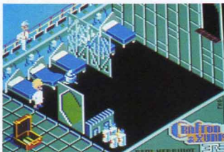
Un grand bond vous mènera jusqu'à la porte du haut.

Vous avez appuyé sur le bouton de feu et vous voilà, subito illico et presto, dans un décor en trois dimensions, une pièce cubique, vue par un des coins. Sur le bord gauche de l'écran, on aperçoit la mallette pour l'objet possédé et sur la ligne du bas, trois informations : l'énergie en pourcentage, le code à huit tirets qui seront progressivement remplacés par des chiffres de 1 à 4 et l'indication du score. Si vous restez immobile dans une pièce sans rien tenter de spécial et sans qu'aucun robot ne vous agresse, vous perdrez un point de pourcentage toutes les trente secondes environ. Il va sans dire qu'à partir de 20 %, un clignotement vous indiquera qu'il est grand temps d'aller