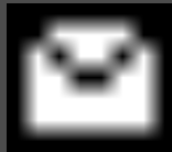
Sobre lanzado para sobornar