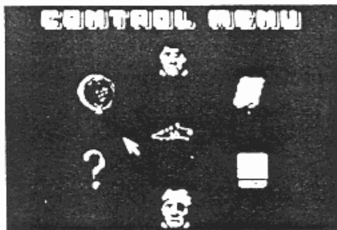
Fig. 1 Menu de Commandes

Et maintenant, c'est parti. Vous verrez devant vous le menu principal de commandes. C'est de là que toutes les décisions sont prises.